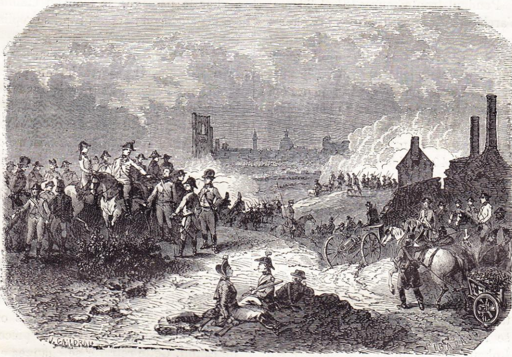
Siège de Saragosse (février 1809).

Ney évacua la Galice; une expédition de Soult dans le Portugal échoua, mais il arriva assez à temps à la bataille de Talaveyra (26 juillet), livrée par le roi Joseph à sir Wellesley, pour contraindre ce dernier, quoique quasi vain-