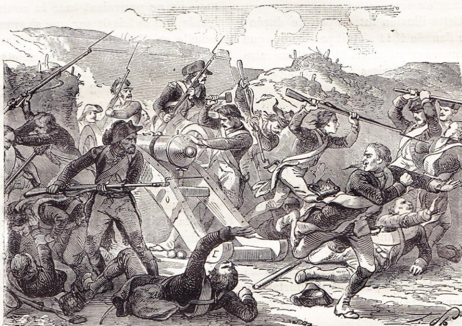
Enlèvement des hauteurs de Wagram.

tant que les inquiétudes venaient : la spoliation des Bourbons d'Espagne et la captivité du pape les avaient éveillées ; la guerre d'Espagne, l'insurrection qu'on savait prête à éclater en Allemagne, puisque Napoléon avait failli être assassiné au milieu de son armée par un étudiant nommé Staaps, les redoublèrent, et les alarmes que donna la bataille d'Essling ne furent pas